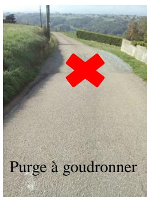
Purge à goudronner

Au carrefour du Chemin de Cherville, des travaux de modification des réseaux et la suppression de poteaux sont en cours, avant la sécurisation du carrefour d'ici la fin de l'année.